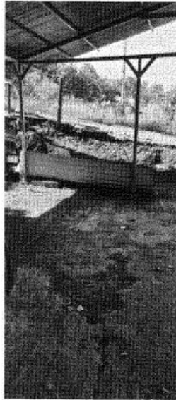
Se logra apreciar que ya la estructura de chorrea de piso se encuentra deteriorada.